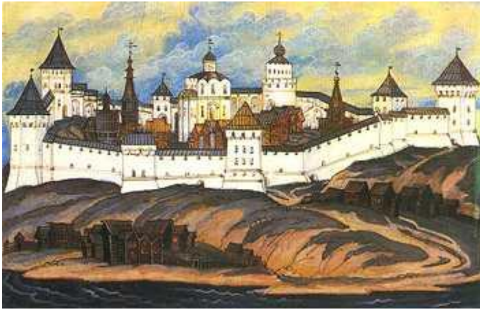
Изображение древнего города

Деревянные стены и башни Можайска существовали с самого основания города; известно, что в XVI веке деревянная крепость ремонтировалась. История говорит, что в 1514 году в Можайске сооружают мощные укрепления - частично в камне, частично в дереве. Крепость, можно полагать, была поставлена на месте прежнего детинца и имела в плане форму неправильного шестиугольника. С юго-восточной стороны к крепости прилегал посад. Но в описи 1596-1598 гг. отмечается, что деревянные стены (имевшие окружность около 650 м) и башни Можайского кремля окончательно пришли в ветхость. Сохранились лишь названия башен: Никольская проездная башня с церковью, башня Кухня, Косая Стрельня, Петровская (с воротами), полубашенья Сурино-колени, Глухая, Красная и др.